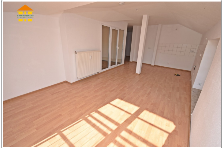
Wohnbereich mit Kochbereich