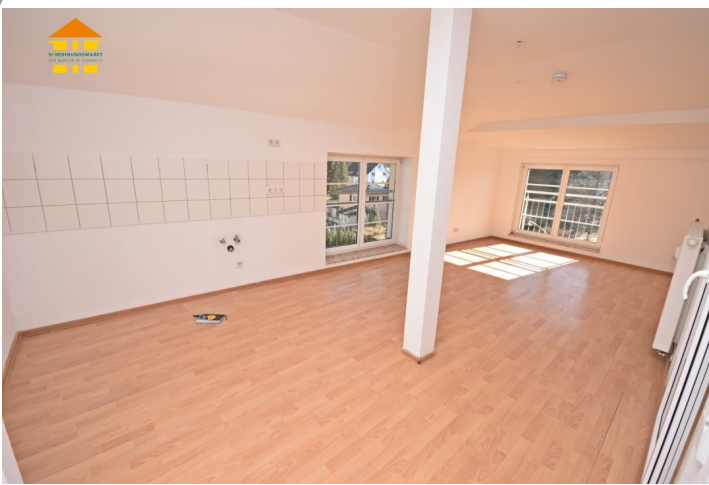
Wohnbereich mit Küchenzeile