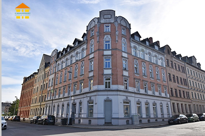
Bernhardstraße 36 in 09126 Chemnitz