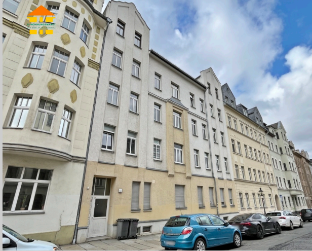
Gießertstraße 12 in 09130 Chemnitz