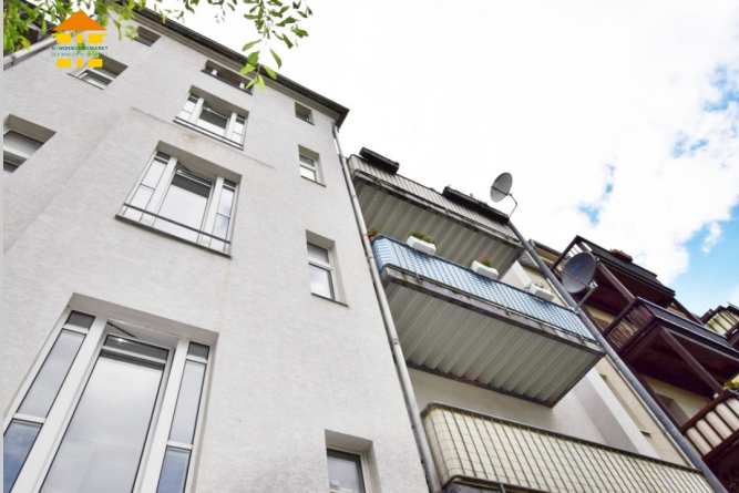
Agnesstraße 2 in 09113 Chemnitz