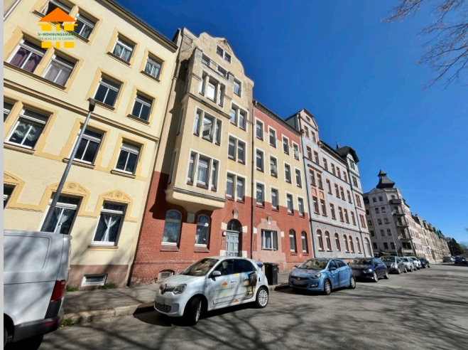
Jakobstraße 51 in 09130 Chemnitz