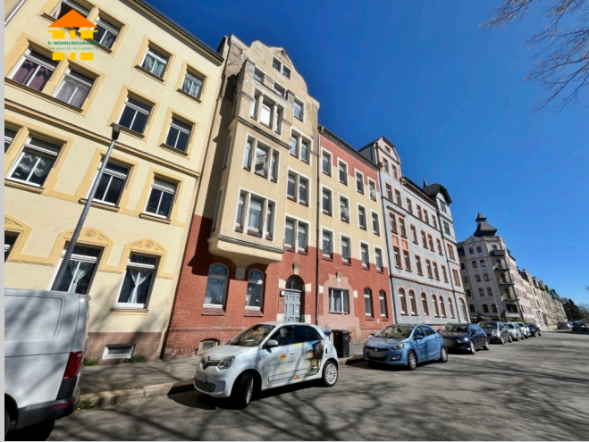
Jakobstraße 51 in 09130 Chemnitz