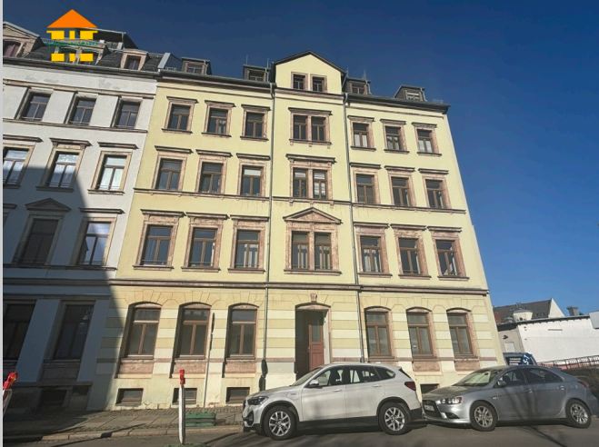
Lessingstraße 11 in 09130 Chemnitz