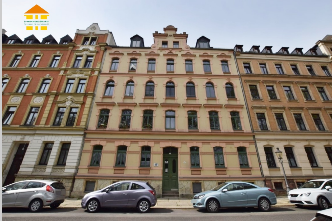
Schloßplatz 3 in 09113 Chemnitz