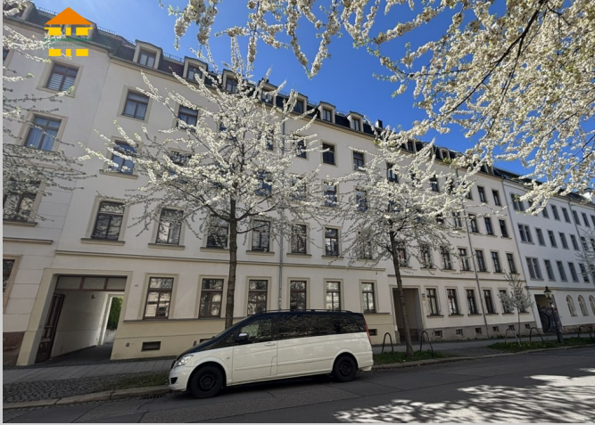
Zöllnerstraße 29 in 09111 Chemnitz