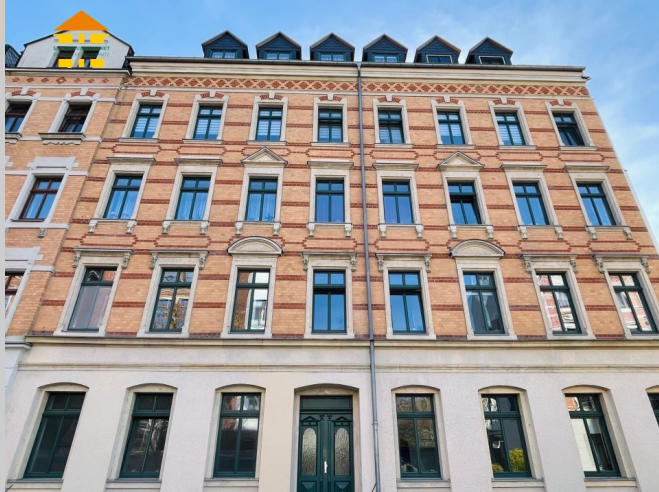
Kanalstraße 29 in 09113 Chemnitz