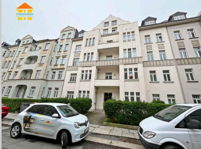
Theodor-Lessing-Straße 17 in 09112 Chemnitz