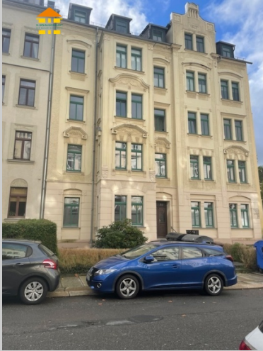
Theodor-Lessing-Straße 07 in 09112 Chemnitz