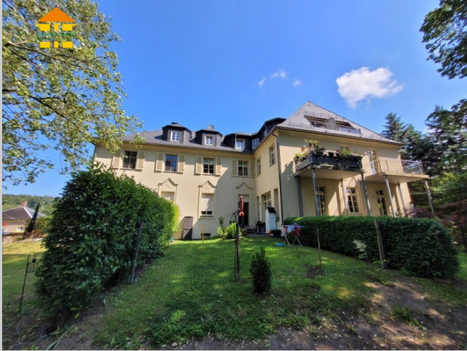
Chemnitzer Straße 180 in 09224 Chemnitz