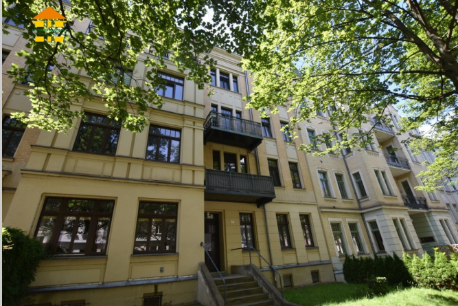
Franz-Mehring-Straße 3 in 09112 Chemnitz