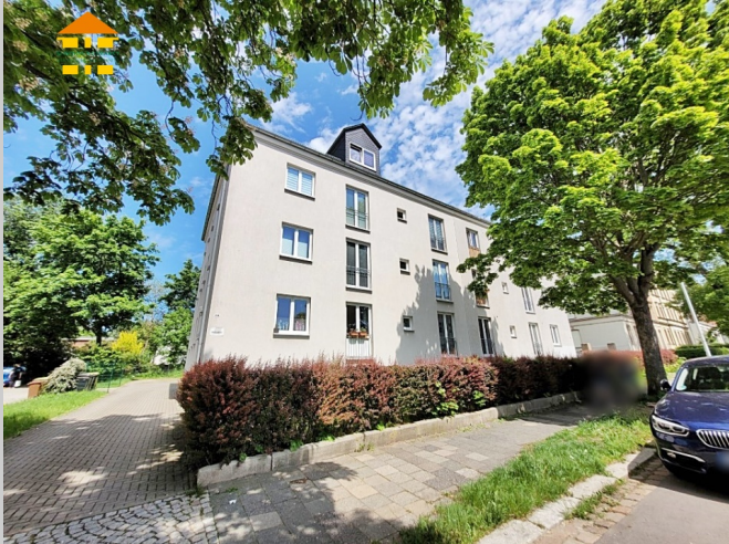
Florastraße 20 in 09131 Chemnitz