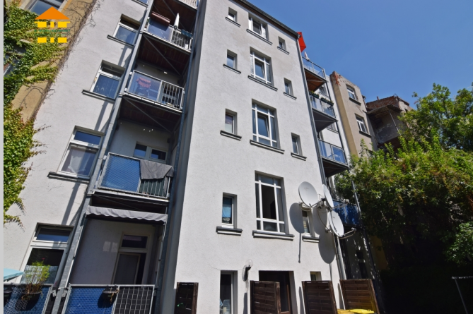
Gießertstraße 4 in 09130 Chemnitz