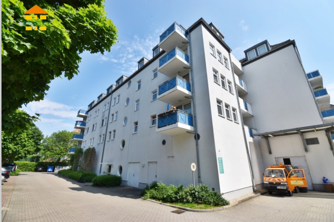
Altendorfer Straße 28 in 09113 Chemnitz