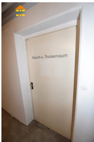
Wasch- und Trockenraum