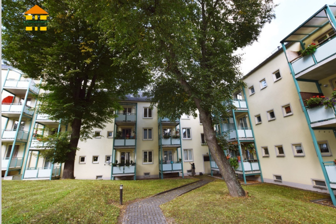
Hofer Straße 32 in 09130 Chemnitz

Das Wohnhaus befindet sich auf dem Chemnitzer Sonnenberg. Dieser Stadtteil besticht besonders durch seinen offenen und lebendigen Charakter. Zahlreiche Imbisse, Einzelhandelsgeschäfte und Startups, haben sich in den vergangenen Jahren auf dem Sonnenberg niedergelassen. Eine Vielzahl an bekannten, exzellenten Bars und Restaurants, befinden sich ebenso auf dem Sonnenberg. Ein weiterer positiver Aspekt eines Lebens auf dem Sonnenberg ist die zentrale Lage, sowie die sehr gut ausgebaute Infrastruktur des Stadtteils. Einrichtungen des täglichen Bedarfs sind in nur wenigen Gehminuten erreichbar.