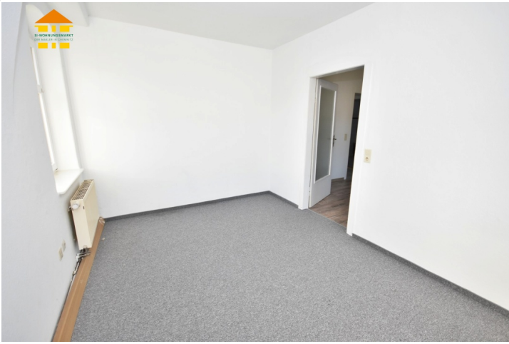
Arbeits-/ und Kinderzimmer