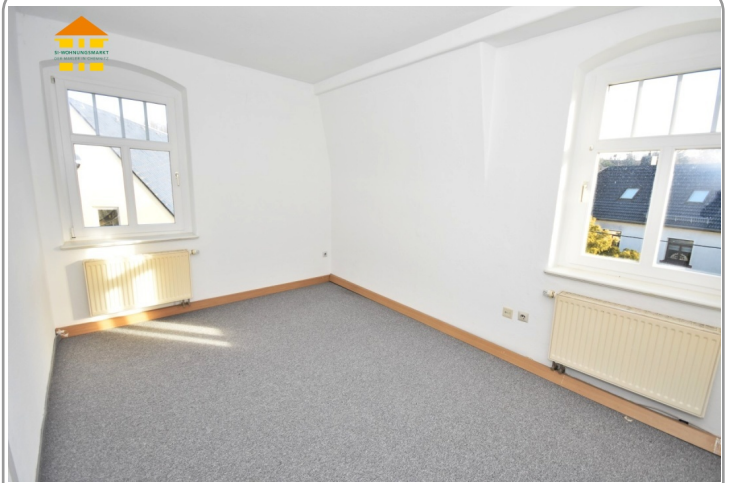
Arbeits-/ und Kinderzimmer