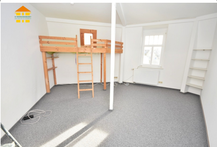
Arbeits-/ und Kinderzimmer 2