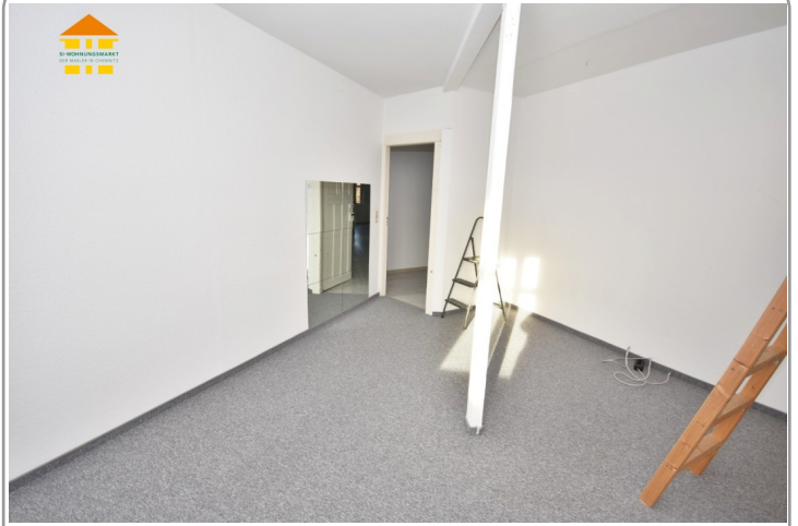
Arbeits-/ und Kinderzimmer 2