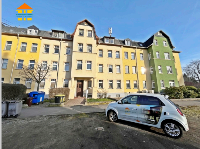
Schulstraße 97 in 09125 Chemnitz