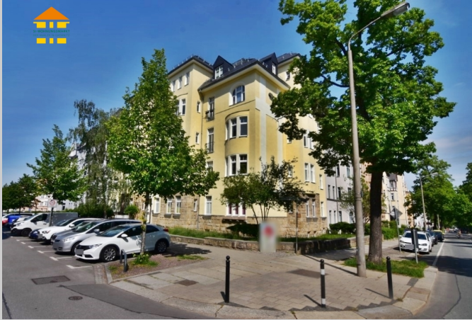
Walter-Oertel-Straße 38 in 09112 Chemnitz

Das Mehrfamilienhaus befindet sich in einem der größten Gründerzeit- und Jugendstilviertel Deutschlands - dem Kaßberg. Der unter allen Bevölkerungsgruppen beliebte Stadtteil zählt seit 1991 als Flächendenkmal. Im Laufe der vergangenen 20 Jahre hat sich der Kaßberg zu dem Place-To-Be in Chemnitz entwickelt. Zahlreiche kleine, ausgefallene und hippe Cafés und Restaurants sind das Aushängeschild des Kaßbergs.