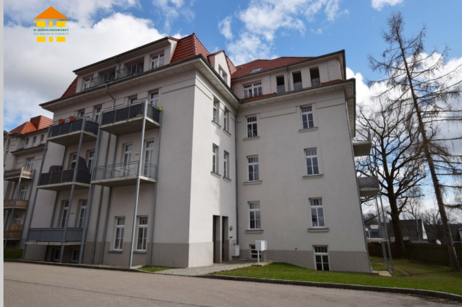
Irmtraud-Morgner-Straße 5 in 09131 Chemnitz

Im Norden von Chemnitz, der ehemaligen „Karl-Marx-Stadt“ befindet sich der naturnahe Stadtteil Ebersdorf. Besonders junge Familie schätzen die Zentrumsnähe in Verbindung mit der Ruhe der Natur sehr. Der Ebersdorfer Wald und die Felder des Stadtteils eignen sich ideal für entspannte Spaziergänge und sportliche Aktivitäten. Das Zentrum erreicht man über die Frankenberger Straße in ca. 15 Minuten, auch die Autobahn A4 ist in nur wenigen Minuten mit dem Auto zu erreichen. Einrichtungen des täglichen Bedarfes, wie Schulen, Arztpraxen und Lebensmittelgeschäfte sind in nur wenigen Gehminuten erreichbar.