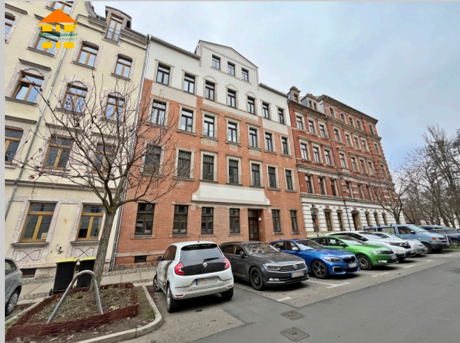
Uhlandstraße 35 in 09130 Chemnitz