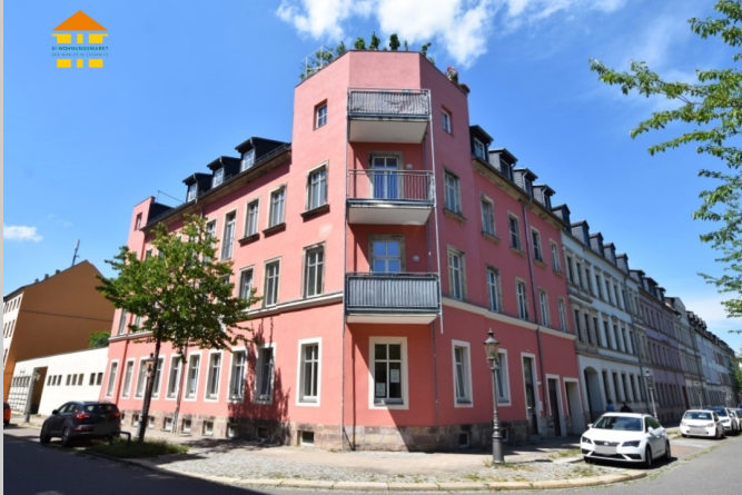
Lerchenstraße 1 in 09111 Chemnitz

Die Immobilie befindet sich im Zentrum der Stadt der Moderne. Dieser, der Stadt Chemnitz im Jahre 2007 verliehene Titel, trifft besonders auf das Chemnitzer Zentrum zu. Der Stadtteil erstreckt sich von der Müllerstraße im Norden über die Dresdner Straße im Westen bis hin zur Rembrandtstraße im Süden. Das Zentrum mit der belebten Chemnitzer Innenstadt bietet viele Möglichkeiten der aktiven und kulturellen Freizeitgestaltung. Zahlreiche Museen, wie das SMAC oder auch die Kunstsammlungen am Theaterplatz, locken mit atemberaubenden Ausstellungen. Unvergessliche Momente erleben Sie bei verschiedensten Veranstaltungen in der Stadthalle oder in der Oper.