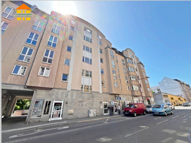
Limbacher Straße 71 in 09113 Chemnitz