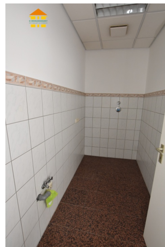
Gewerbeeinheit 2. OG