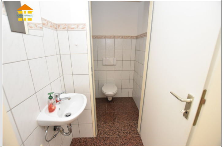
Gewerbeeinheit 1.OG links