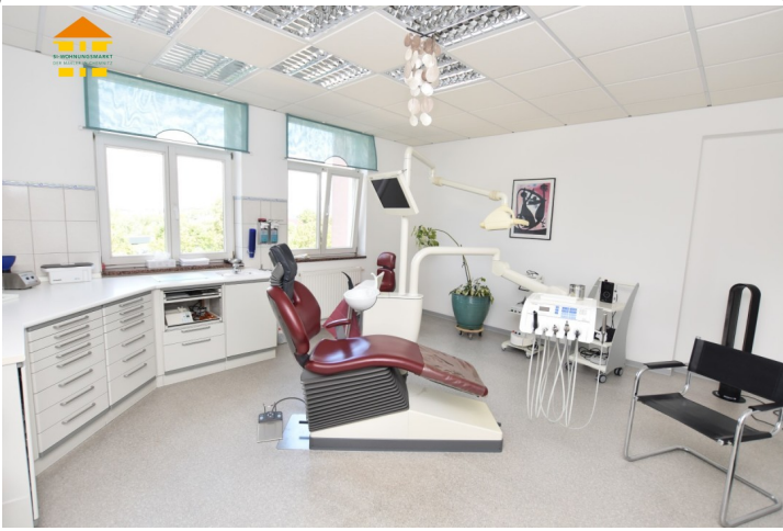
Gewerbeeinheit 3.OG rechts