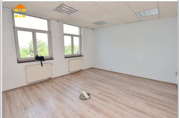
Gewerbeeinheit 3.OG links