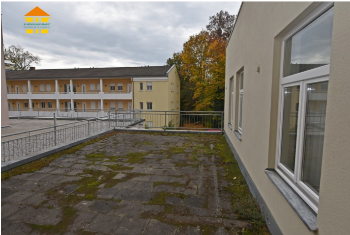
Gewerbeeinheit 1.OG rechts