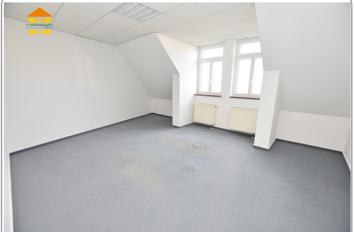
Gewerbeeinheit 4.OG rechts