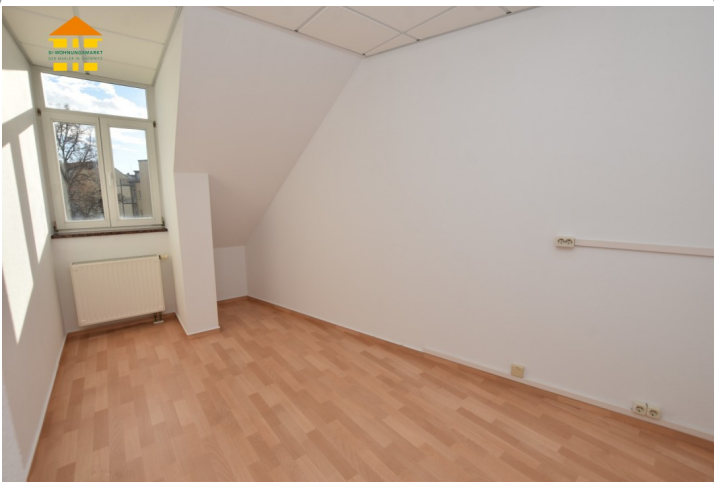
Gewerbeeinheit 4.OG rechts