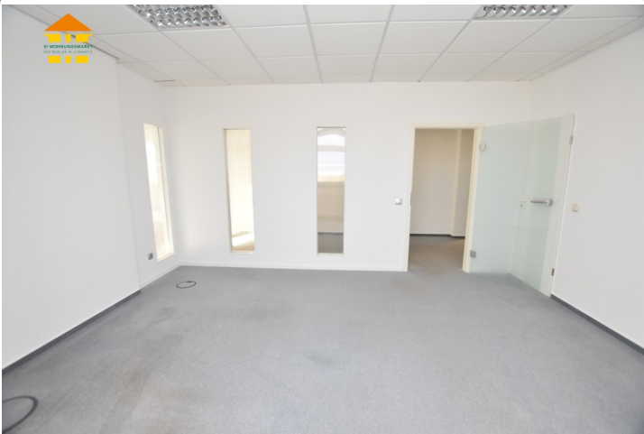
Gewerbeeinheit 4.OG rechts