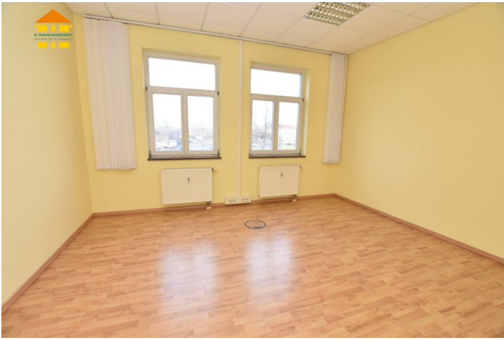
Gewerbeeinheit 1.OG links