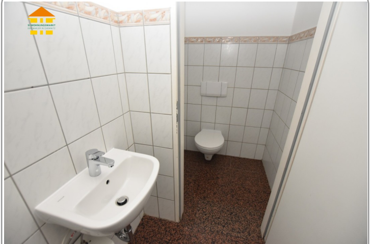
Gewerbeeinheit 4.OG links