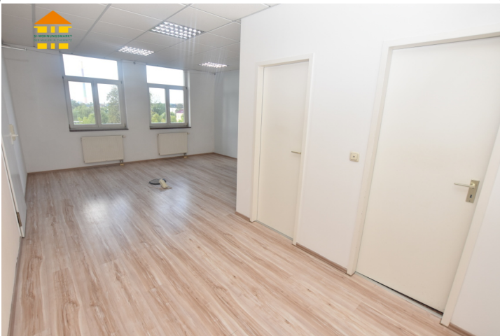
Gewerbeeinheit 3.OG links