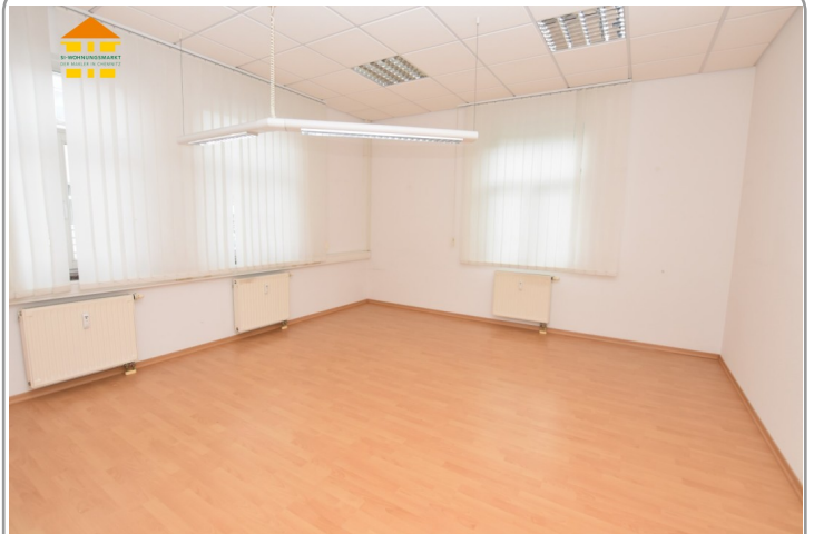
Gewerbeeinheit 1.OG rechts