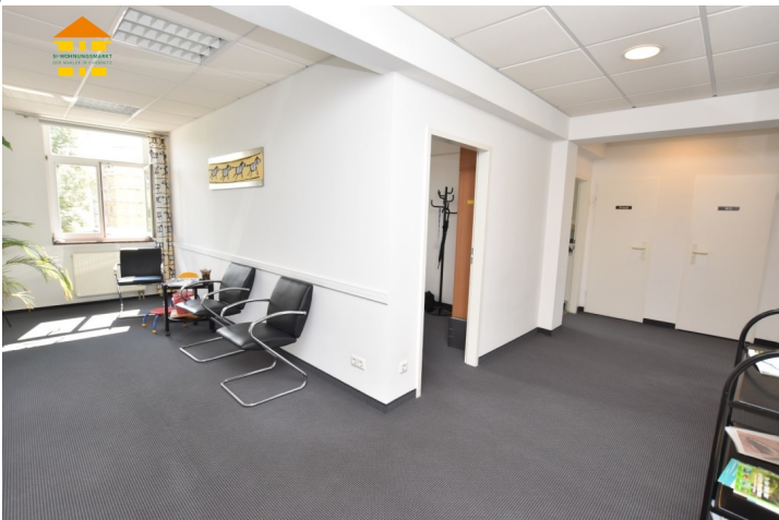
Gewerbeeinheit 3.OG rechts