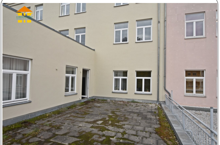
Gewerbeeinheit 1.OG rechts