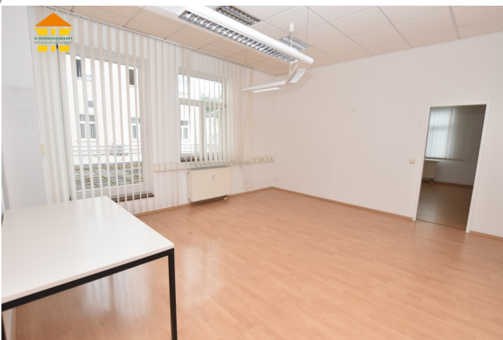
Gewerbeeinheit 1.OG rechts