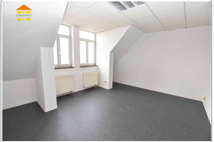
Gewerbeeinheit 4.OG links