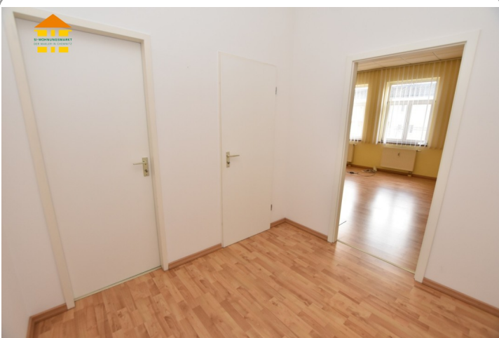
Gewerbeeinheit 1.OG links