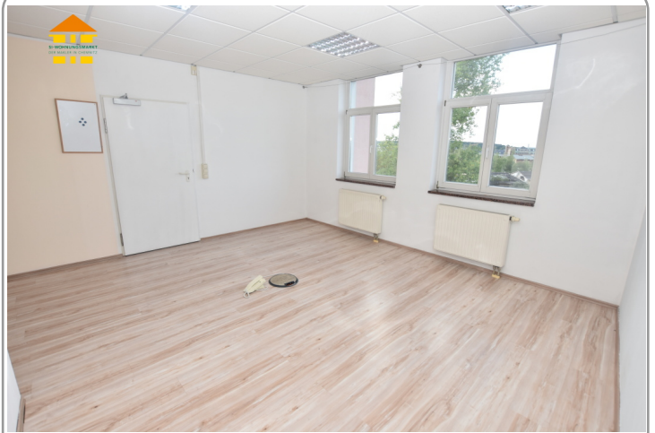
Gewerbeeinheit 3.OG links