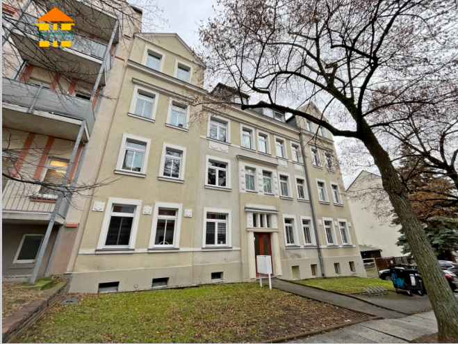
Nürnberger Straße 10 in 09130 Chemnitz