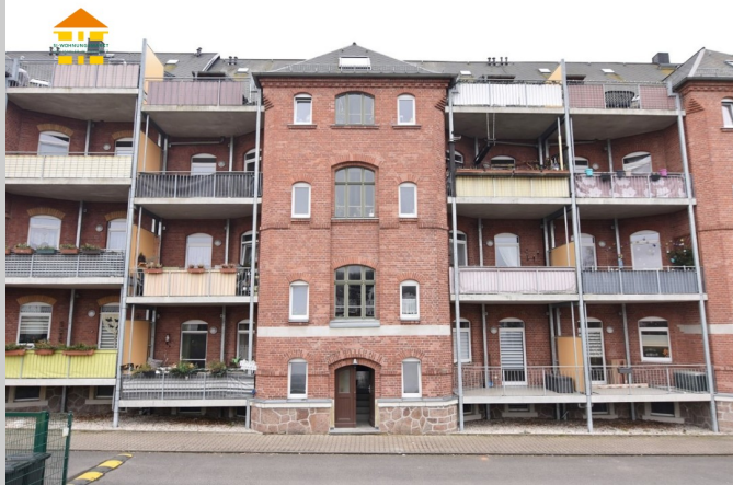
Ebersdorfer Straße 33 in 09131 Chemnitz