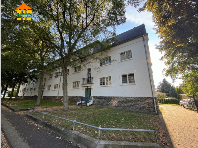
Heimgarten 40 in 09127 Chemnitz