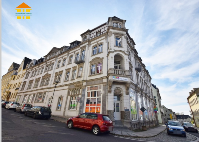
Straße der deutschen Einheit 25-27 in 09217 Burgstädt