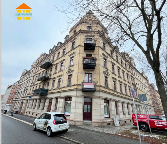
Fürstenstraße 45 in 09130 Chemnitz