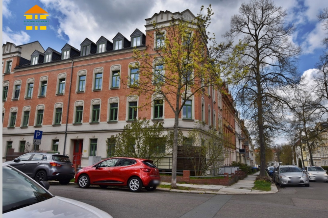
Ricarda-Huch-Straße 12 in 09116 Chemnitz