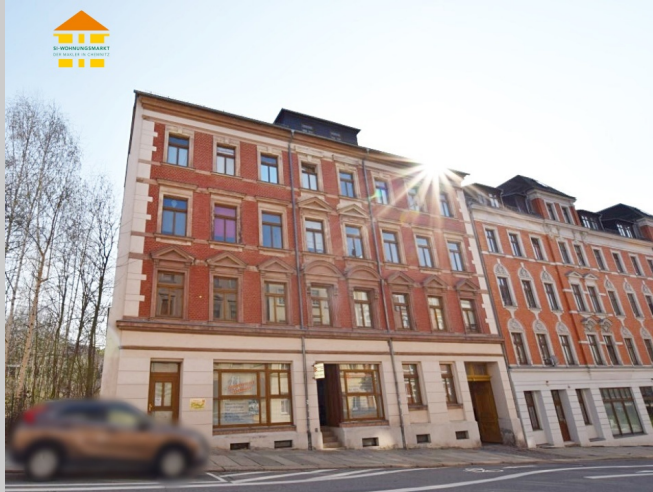
Bergstraße 8 in 09113 Chemnitz