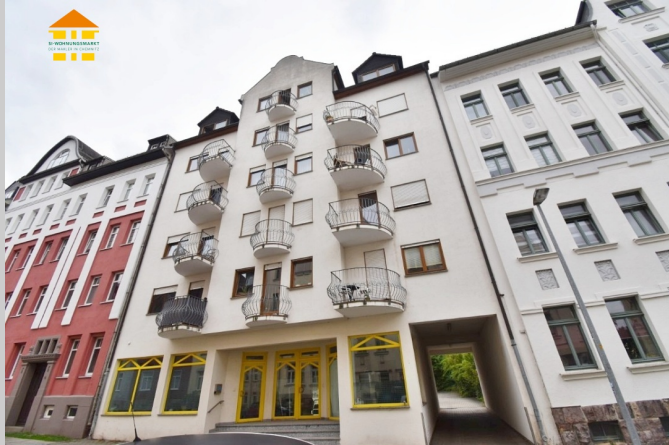
Casparistraße 2 in 09126 Chemnitz