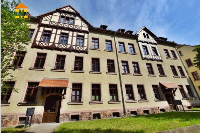
Altchemnitzer Straße 72 in 09120 Chemnitz