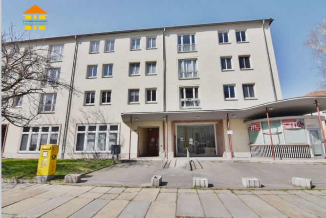
Lutherstraße 18 in 09126 Chemnitz