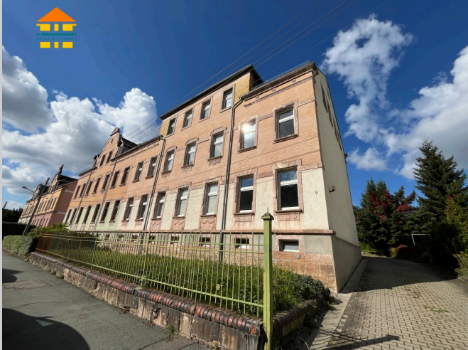
Klopstockstraße 9 in 09131 Chemnitz