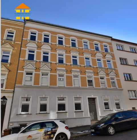
Ulbrichtstraße 11 in 09126 Chemnitz