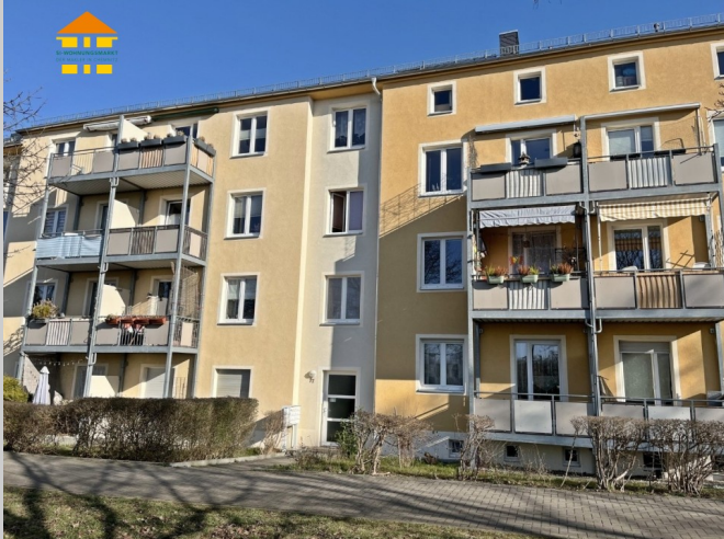
Beethovenstraße 73 in 09130 Chemnitz