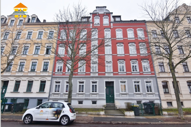
Hilbersdorfer Straße 68 in 09131 Chemnitz