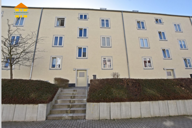
Beethovenstraße 46 in 09130 Chemnitz