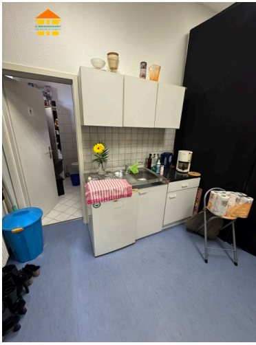
Küche / Pausenraum