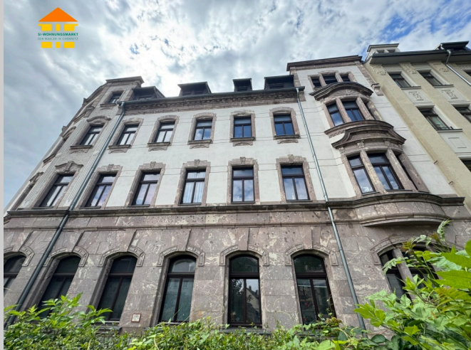
Frankenberger Straße 49 in 09131 Chemnitz