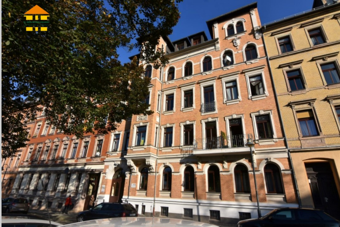
Pestalozzistraße 5 in 09130 Chemnitz

Das Wohnhaus befindet sich auf dem Chemnitzer Sonnenberg. Dieser Stadtteil besticht besonders durch seinen offenen und lebendigen Charakter. Zahlreiche Imbisse, Einzelhandelsgeschäfte und Startups haben sich in den vergangenen Jahren auf dem Sonnenberg niedergelassen. Dank der bunt gemischten Bevölkerung und dem Leben, welches sich zwischen den Häusern und Gärten abspielt, erlangt der Stadtteil immer mehr Zuspruch.