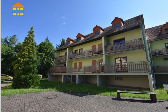
Straße des Friedens 12 in 09557 Flöha