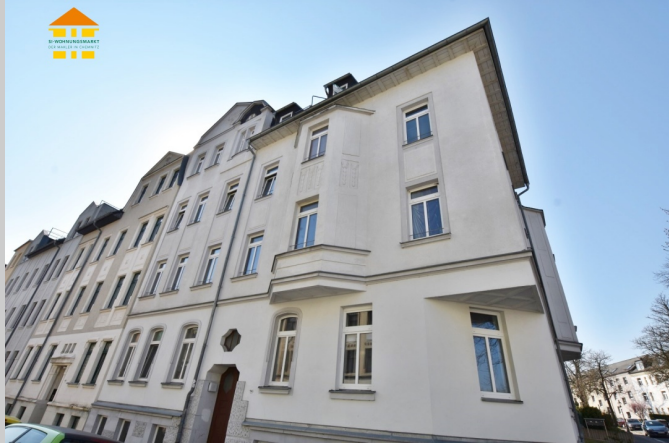
Bernhardstraße 114 in 09126 Chemnitz