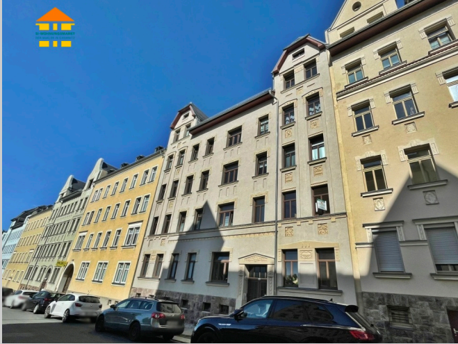
Senefelderstraße 9 in 09126 Chemnitz