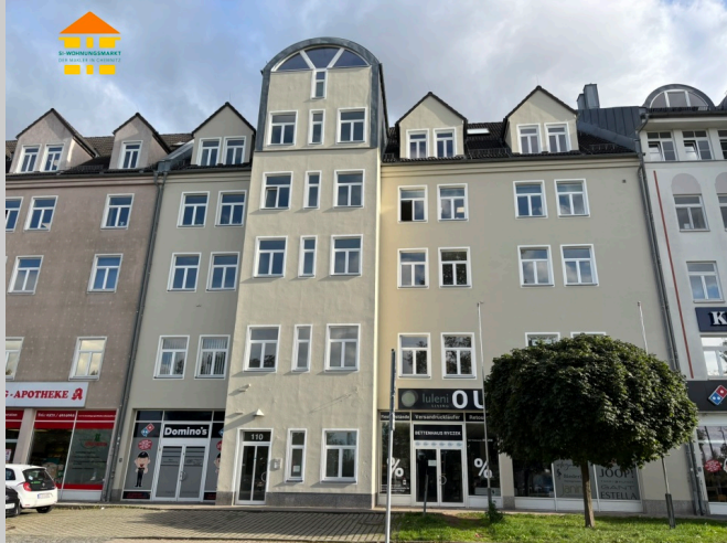
Hainstraße 110 in 09130 Chemnitz