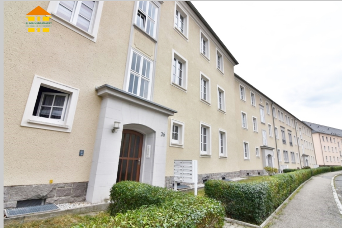
Erich-Steinfurth-Straße 22 in 09131 Chemnitz