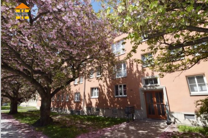
Lutherstraße 34 in 09126 Chemnitz