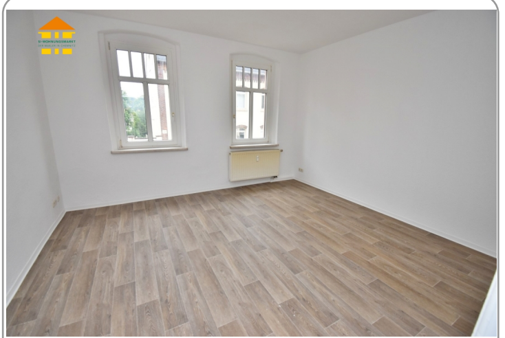
Wohn- / Schlafbereich