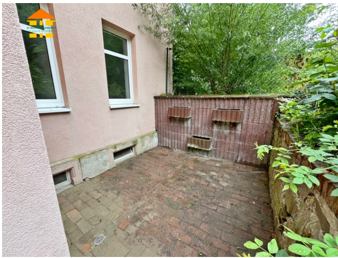
Terrasse im Innenhof