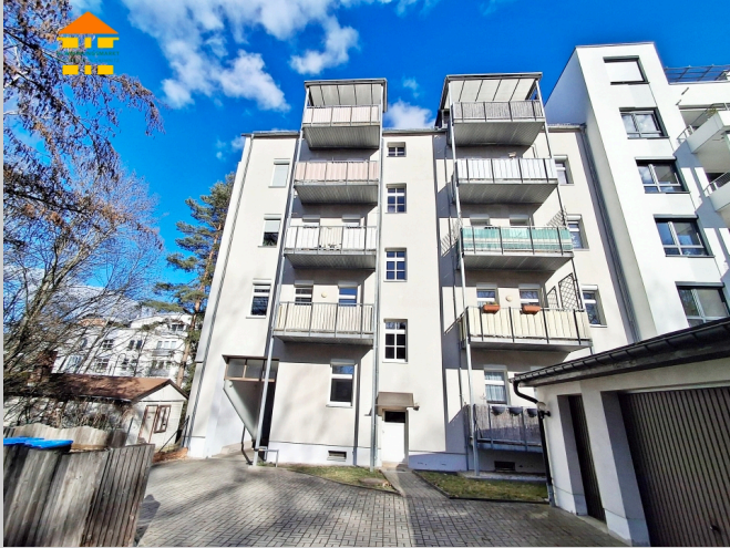
Kanzlerstraße 19 in 09112 Chemnitz